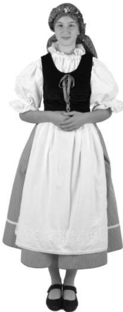
Dívka v tanečním kroji